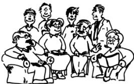
Bibel - Hauskreis